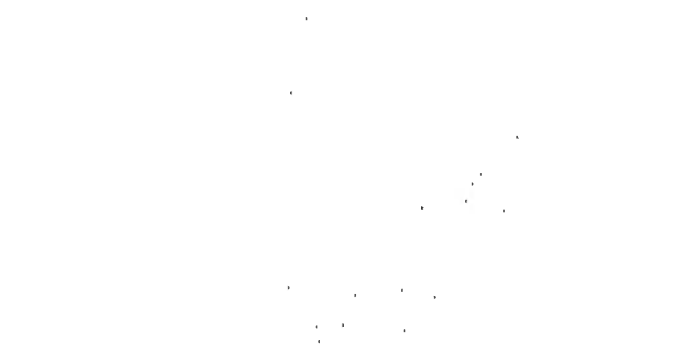
Figure 1: A line graph showing the relationship between the number of days of rain (x-axis, 0 to 10) and the number of days of sunshine (y-axis, 0 to 10). The data points are (0, 10), (1, 9), (2, 8), (3, 7), (4, 6), (5, 5), (6, 4), (7, 3), (8, 2), (9, 1), and (10, 0). A straight line is drawn through these points, showing a negative linear correlation.

The graph shows a clear negative linear correlation between the number of days of rain and the number of days of sunshine. As the number of rainy days increases, the number of sunny days decreases proportionally.